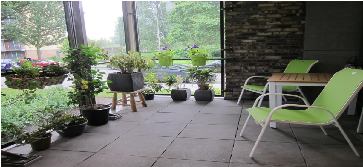
Het balkon van het Thuishuis.