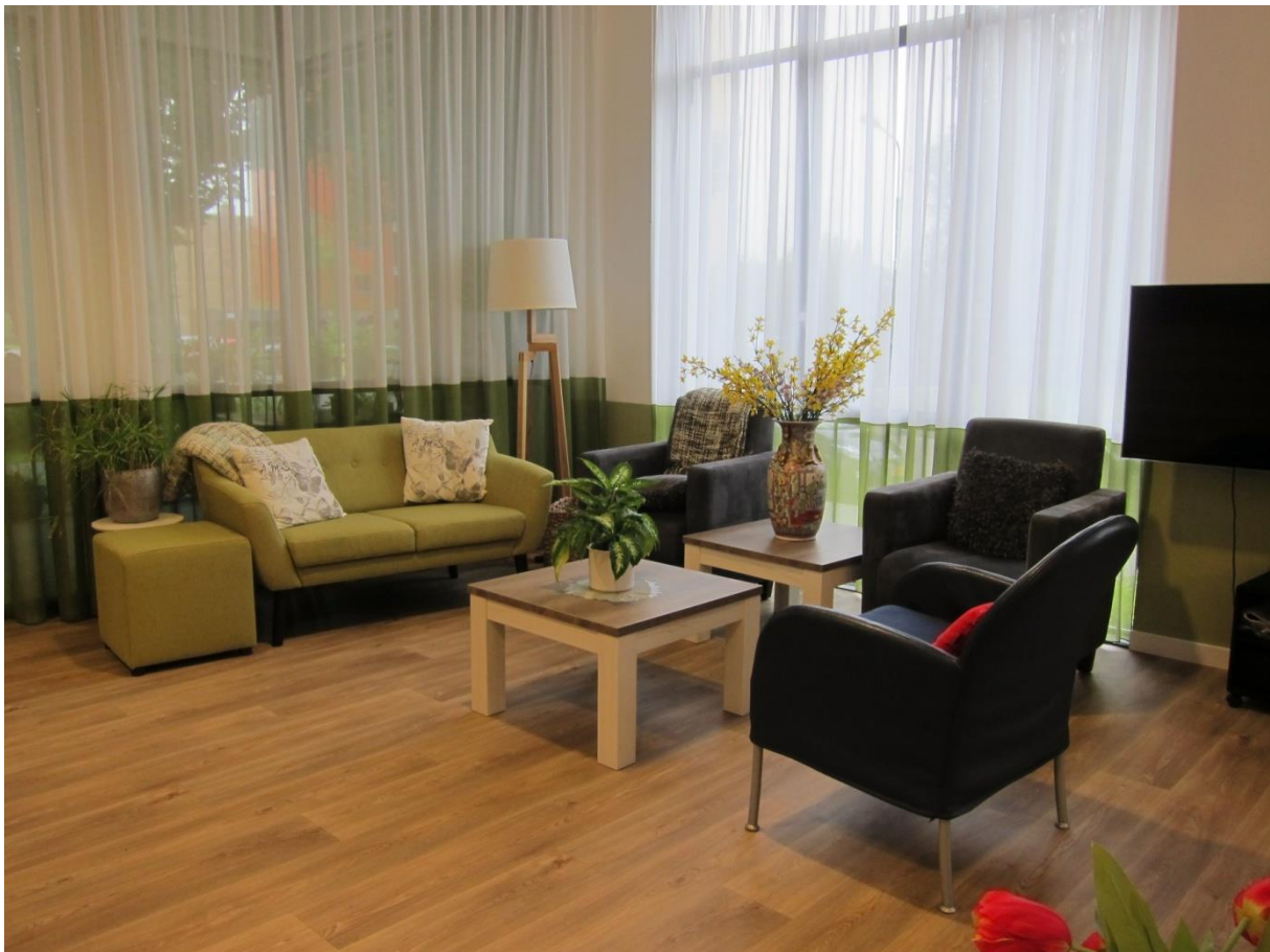
De gemeenschappelijke woonkamer in het Thuishuis

In dit bestuurlijk jaar passeerde een gevarieerd aantal werkzaamheden en gebeurtenissen de revue. Er zijn regelmatig bestuursvergaderingen gehouden en er zijn besprekingen gehouden met diverse instanties op het gebied van ouderenzorg. Van de gemeente Amstelveen is een bijdrage ontvangen voor de periode 2016 tot en met 2018., waarvoor het bestuur de gemeente zeer erkentelijk is. Van andere fondsen is eveneens een bijdrage ontvangen voor het vergroten van de naamsbekendheid en de opleiding, werving en coaching van vrijwilligers.