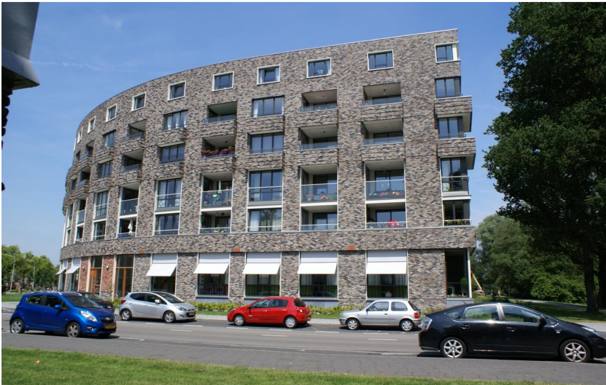
Thuishuis Amstelveen, Lindepark 80 tot 86A De beneden etage is ingericht door en voor het Thuishuis Amstelveen...